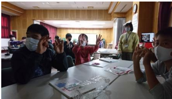
③レクリエーション(その1)