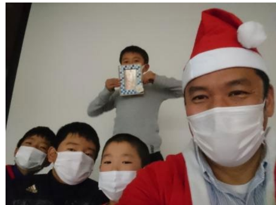
⑥サンタと一緒に記念写真