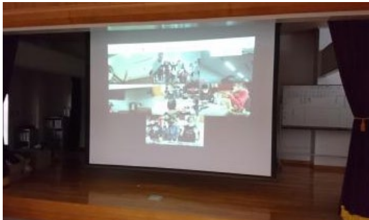
①大学生による大学紹介(その1)