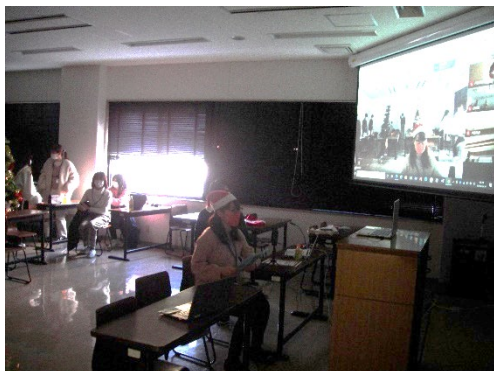
①開会あいさつ(その1)