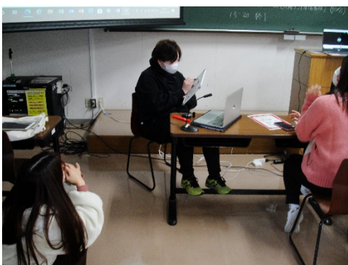
⑮レクリエーション(その7)