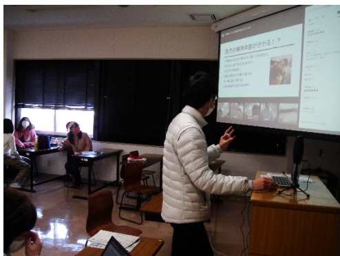
⑬レクリエーション(その5)