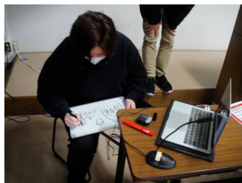
⑯レクリエーション(その8)