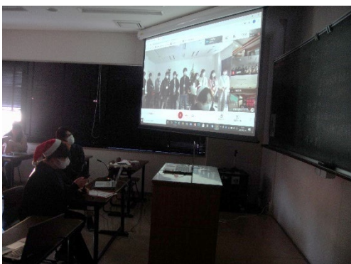
③大学生生活の紹介(その1)