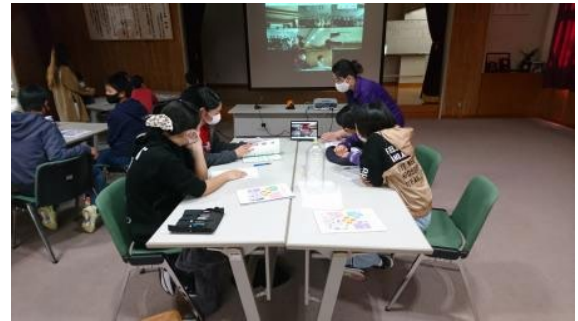
②大学生による大学紹介(その2)