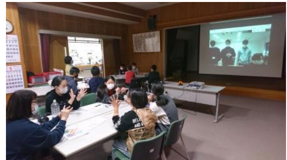
④レクリエーション(その2)