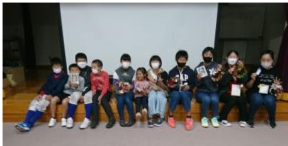
⑤終了後の集合写真(その1)