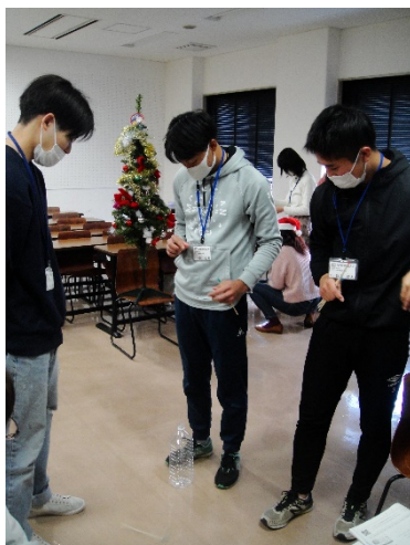
⑪レクリエーション(その3)