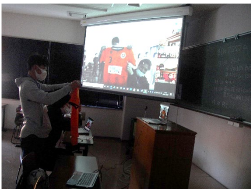
⑤大学生生活の紹介(その3)