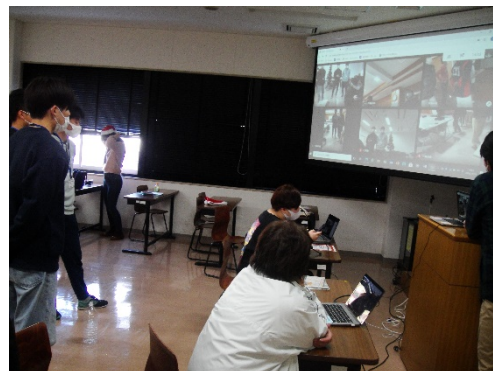
⑨レクリエーション(その2)